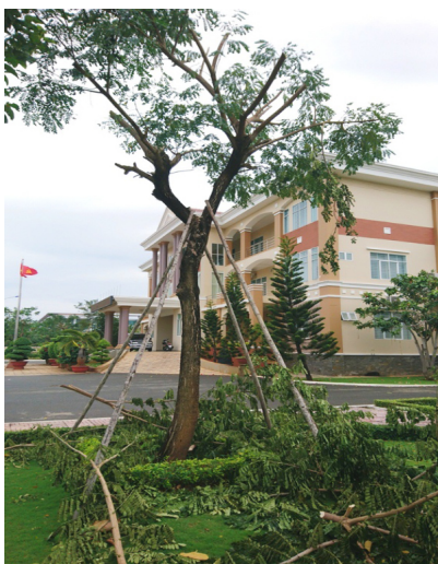
Công tác cắt tỉa cành, chống cọc để bảo vệ cây xanh trong khuôn viên Trường

- Thông báo cho các l p ngh h c đ h c viên (h u h t là cán b , công chí c, viên chí c trên đ a bàn t nh) lo vi c chí ng bão đ a phướng.